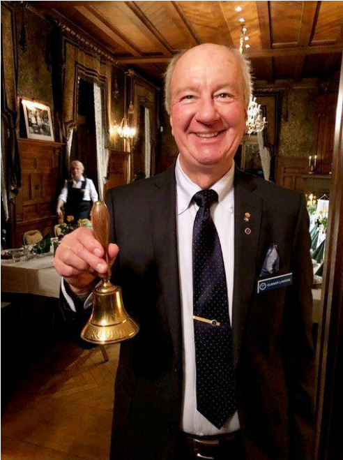
Sällskapsekreteraren kallar till middag med sällskapsinglan.