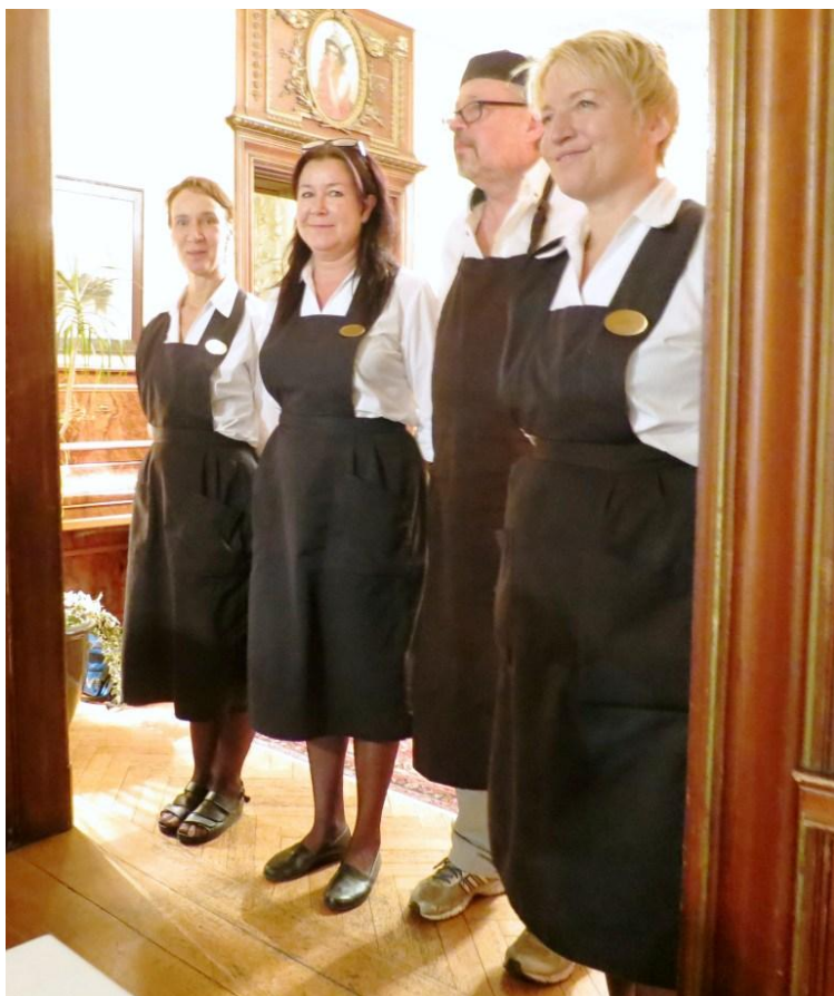
Personalen avtackas sångledes.