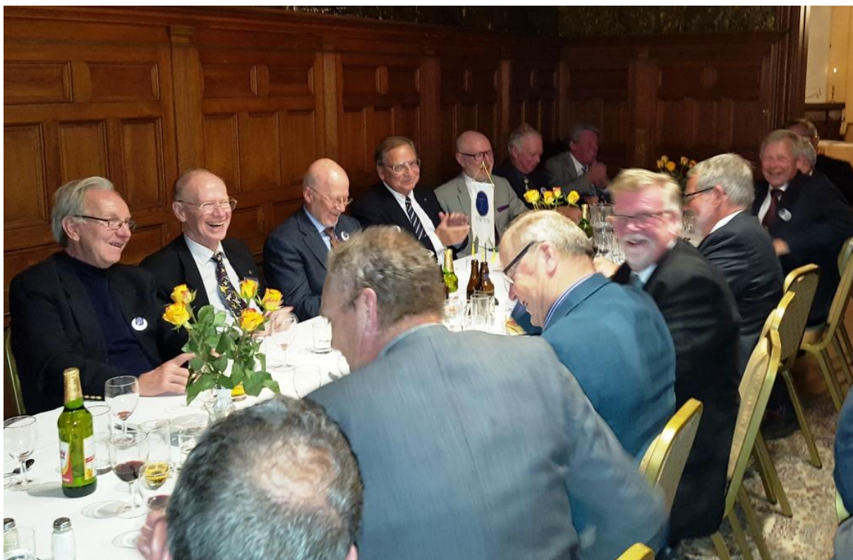
Och ännu mera glada deltagare.