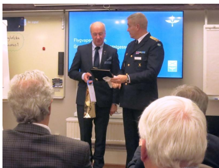
Sällskapssekreteran avtackar FVC med både tavla och ädel dryck.