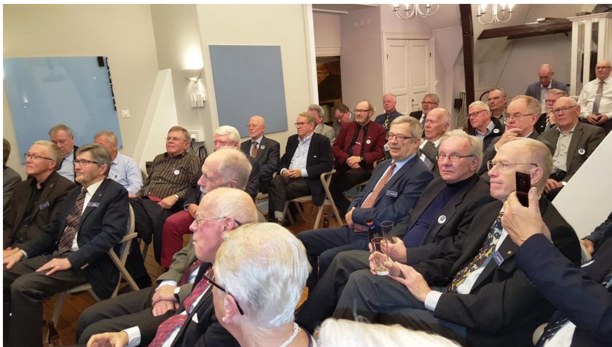
Andäktigt lyssnande medlemmar.