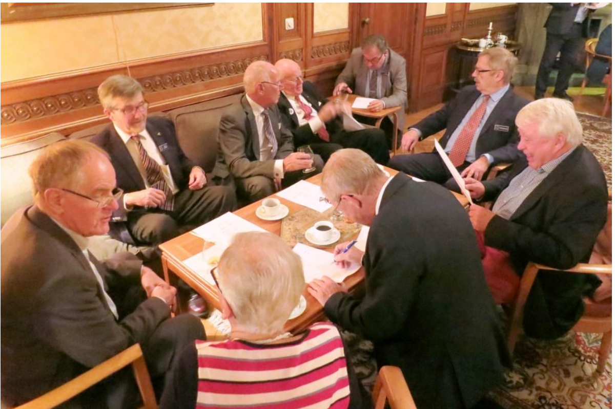
Deltagarna brottas med Rrjal-testets alla frågor.