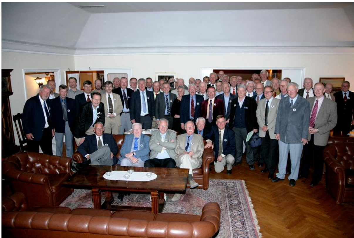
Nästan alla som deltog den 15 maj 2008.

Vi hörs och ses, hadebra i sommar! Eder Envetne Sällskapssekreterare